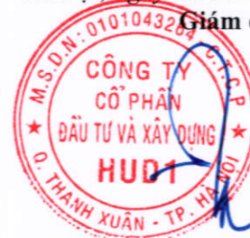
Dương Tất Khiêm